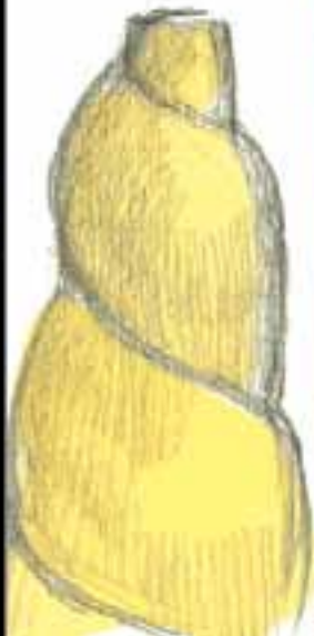
Biomimetica: The Spire