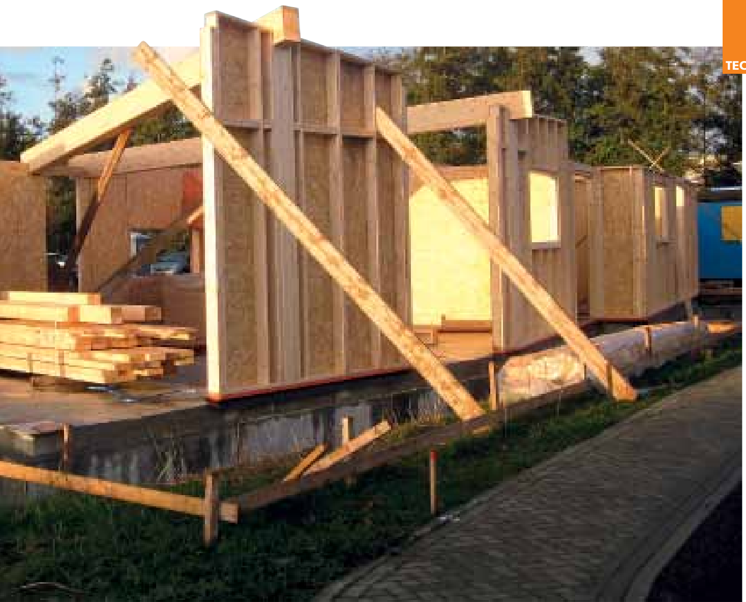
Materialisering: Houtbouw woonhuis

het cement deels vervangen door natuurlijke eiwitten. Ook worden er biobased polymeren ontwikkeld die schadelijke plastics kunnen vervangen en zijn er geleidende polymeren die gebruikt kunnen worden voor het elektriciteitsnetwerk in plaats van metalen zoals bijvoorbeeld koper. Uit het feit dat Biofoam de Nederlandse bouwprijs gewonnen heeft, valt duidelijk af te leiden dat er grote interesse is voor dergelijke 'scheikundige' biobased materialen.