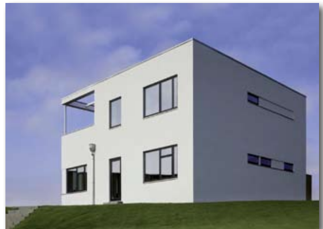
Isover Multi-Comfort House (passiefhuis).

De volgende stap is het behouden van de energie door het gebruik van techniek. Een systeem waar je niet aan voorbij kunt gaan in een passiefhuis is balansventilatie. Bij dit systeem wordt er een constante balans gehandhaafd tussen de verse (koude) lucht die binnenkomt en de gebruikte (warme) lucht die wordt afgezogen. De energie in de vorm van de warmte van de binnenlucht wordt door een warmtewisselaar overgedragen op de binnengebrachte frisse buitenlucht. Er is veel te doen geweest over deze systemen. Frisse lucht door een filter is al snel niet fris meer. Het gevolg was dat door slecht afgestelde systemen of vieze filters de gezondheid van de gebouwgebruikers werd aangetast. Tegenwoordig zijn er ook varianten, waarbij ook rechtstreeks van buiten frisse lucht aangevoerd kan worden en je dus minder afhankelijk bent van het systeem.